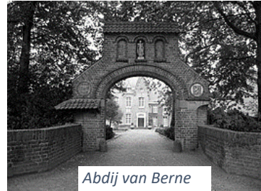
Abdy van Berne

'Wees stil, God wil je zoveel zeggen!' Terugblik kloosterweekend 20-22 januari Elf deelnemers kwamen op vrijdagmiddag 20 januari samen in de abdij van Berne in Heeswijk. Met een kriebel in de buik, want je weet niet precies waar je terecht komt en of het klikt in de groep. De locatie is