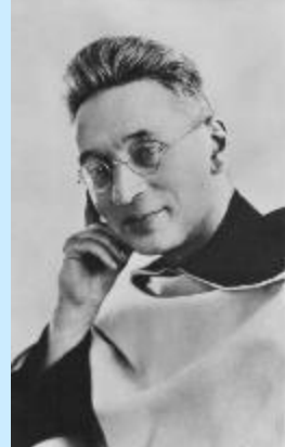
Heilige Titus Brandsma