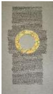
Gekalligrafeerde Karmelregel door Arie Trum