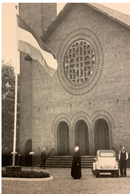
1931- consecratie kerk Bewuste plaats links op beide foto's