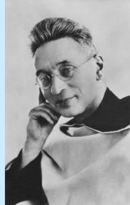
Heilige Titus Brandsma