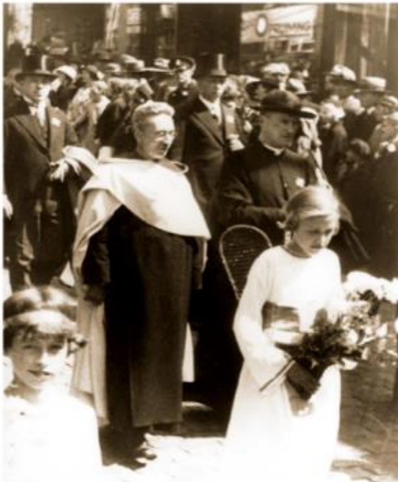
Titus Brandsma, in pij en witte mantel. Hij neemt deel aan de Maria Omdracht te Nijmegen.