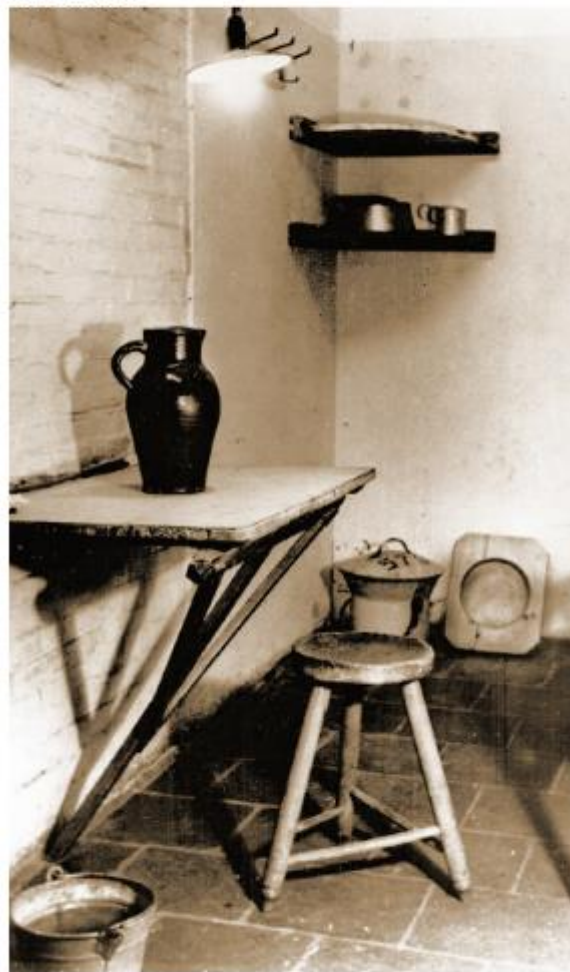
De gevangenis van Titus Brandsma in de Scheveningse gevangenis.

Hij mocht boeken, schrijfmateriaal en tabak hebben. De maaltijden waren heel sober, maar redelijk gezond. Hij mocht zijn eigen kleren dragen. In feite leek het zo'n 'gewone' gevangenis dat hij ervan uitging dat hij wel weer vrij zou komen. Titus begon onmiddellijk zijn gevangeniscel in een kloostercel te veranderen.