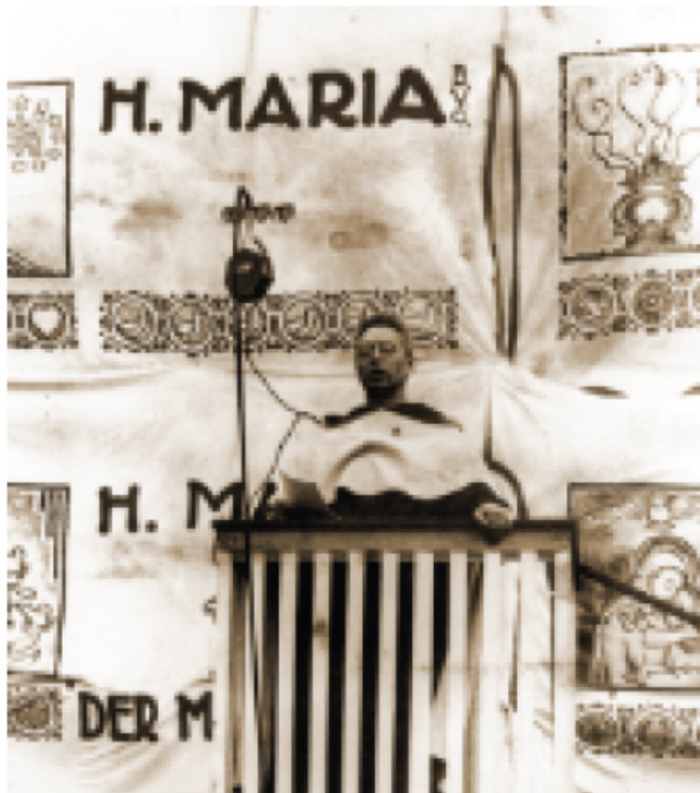
Titus Brandsma, in pij en witte mantel, tijdens het Maria-congres in Nijmegen in 1932.

Titus trad in bij de Karmelieten. vanuit het verlangen naar het intenser gebedsleven vanwege de grote Maria-