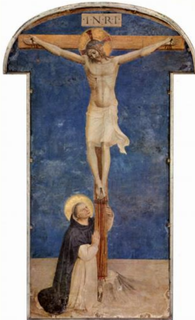
Men neemt aan dat dit het beeld dat Titus in zijn cel had, een fresco van Fra Angelico was: 'Sint Dominicus aanbidt de Gekruisigde .

Een vriend vraagt de moed om te lijden, een 'speciale vriend' vraagt de moed om meer te lijden, zeker als het de vriendschap met Jezus betreft, die het lijden van de mensheid draagt. Wie lijdt met zijn vriend is als hij. Zo lijken de leerlingen van Jezus op Hem. Hij was hen voorgegaan op de weg van het lijden die leidt naar zijn Koninkrijk van vrede.