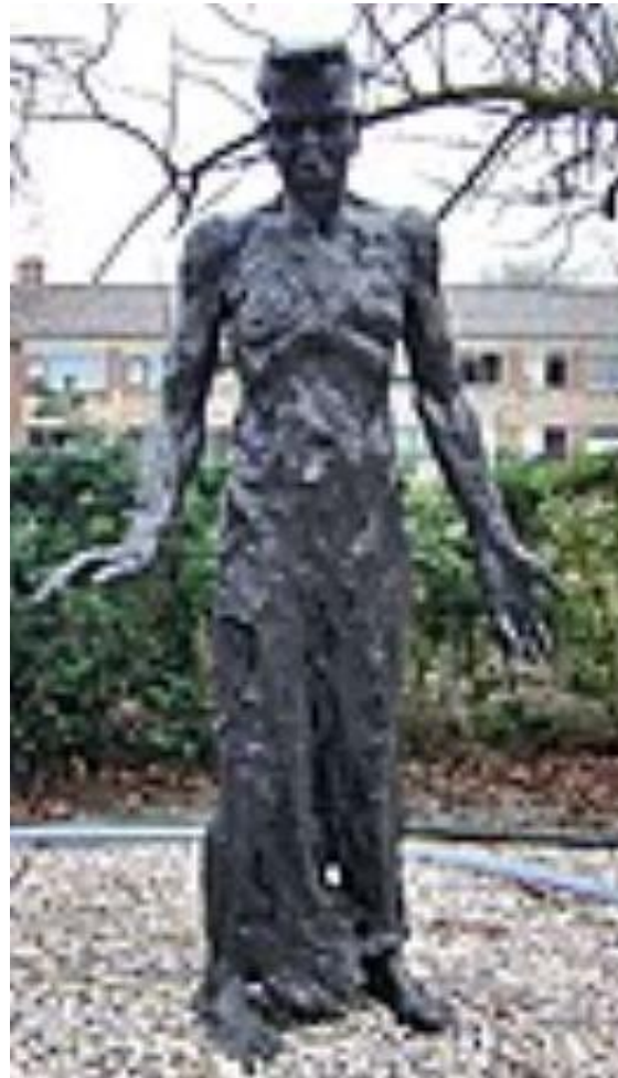
Titus Brandsma Bonifacius Kapel Dokkum

Titus Brandsma, 1939 Mystiek leven een bloemlezing, spiritualiteit, blz. 38.