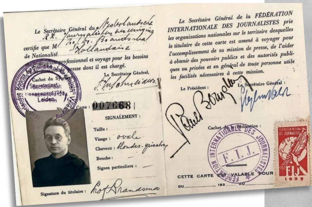
De perskaart van Titus Brandsma

Ondanks deze miserabele behandeling was Titus Brandsma voor zijn omgeving een belangrijke steunpilaar, vertelden medegevangenen later. Met opbeurende woorden wist hij lichtpuntjes te creëren in het zware kampbestaan.