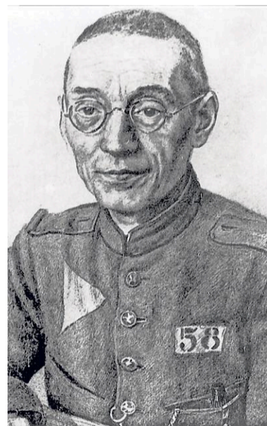
Titus Brandsma, getekend door een medegevangene in kamp Amersfoort.