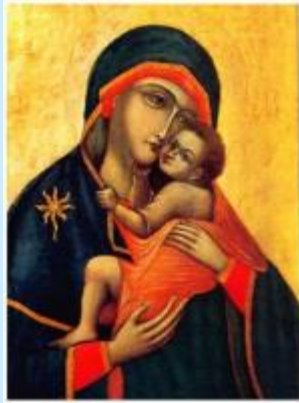
Maria, Onze Lieve Vrouw van de berg Karmel