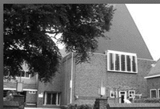
31 maart: Doopsgezinde kerk www.dgaalsmeer.nl