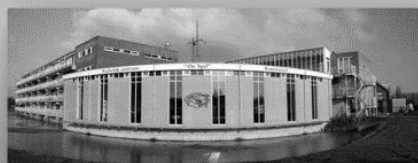
24 maart: De Spil Kudelstaart www.sow-kudelstaart.nl