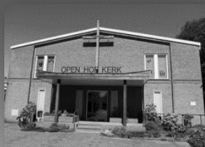
24 februari: Open Hof www.pgaalsmeer.nl

Voor aanvullende informatie: www.kerkpleinaalsmeer.nl