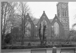
3 maart: NH Dorpskerk www.hervormdaalsmeer.nl/dorpskerk