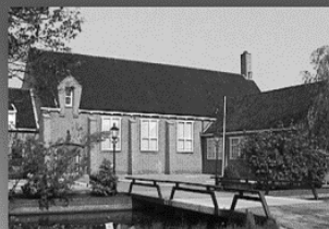
17 maart : Lijnbaankerk www lijnbaankerk.nl