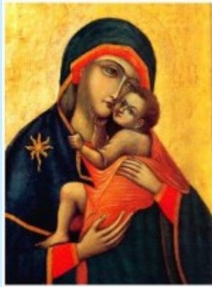
Maria, Onze Lieve Vrouw van de berg Karmel