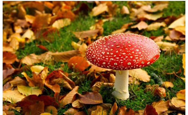
Een kleurrijke herfst.

Ik rekende op uw genade, Heer. Maak Gij mij door uw bijstand blij van hart, dan zal ik steeds uw weldaden bezingen.